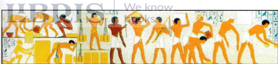
„Robi am fost în țara lui Faraon.” Pictură murală, Beni Hassan, Egipt, sec. XIX î.e.n.

tatălui lor orb, Iacov se luptă cu un Înger care încearcă să scape la ivirea zorilor. Înainte de a-l elibera, Iacov îi cere binecuvântarea. Îngerul îi schimbă numele în Israel („căci ai luptat cu Elohim ca și cu oamenii și ai biruit”, Gen. 33,